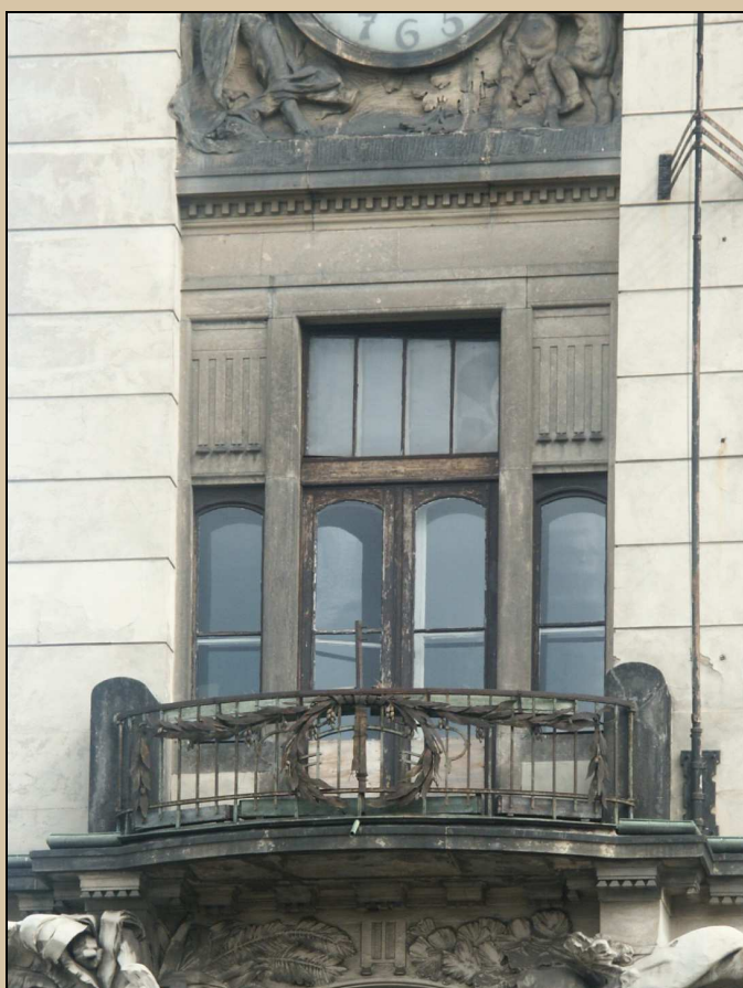
střední část zábradlí