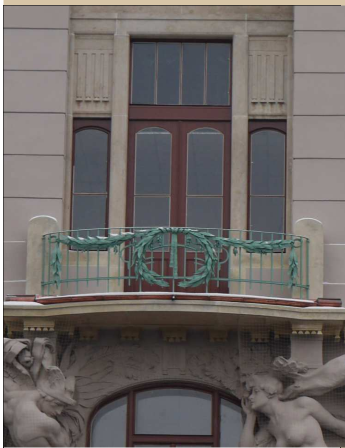
celkový pohled v roce 2016